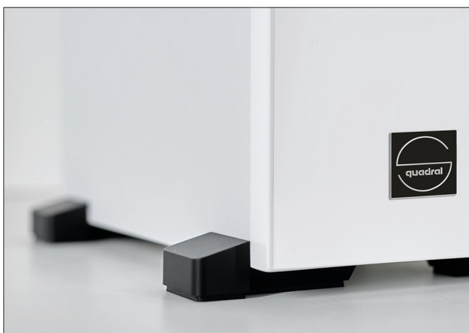
Design-Füße mit integrierter Spike-Aufnahme